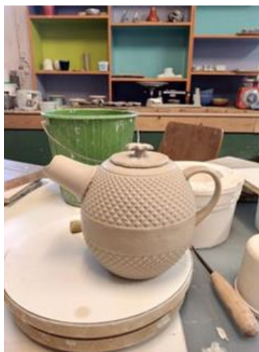
Anja Dekkers is alvast begonnen met het uitdenken van iets moois!

We hadden gehoopt dat de expositie samen kon vallen met de afsluiting van de crisis, maar we moeten nog even volhouden. Over de exacte plaats en datum van de expositie hopen we binnenkort meer duidelijkheid te geven. Laat de klei een middel zijn om samen een positieve draai te geven aan deze uitdagende periode.