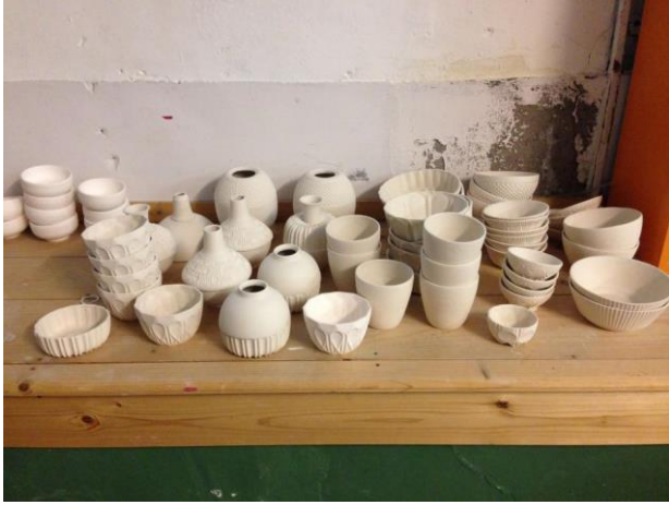
(minder eenvoudige) gipsafgietsels van Anja