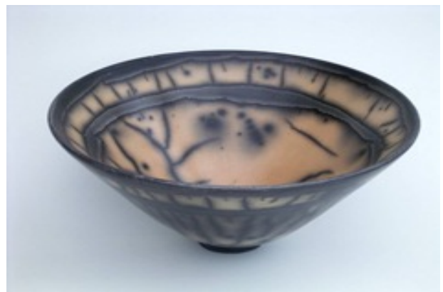
Naked Raku van Tjabel Klok, Opeinde